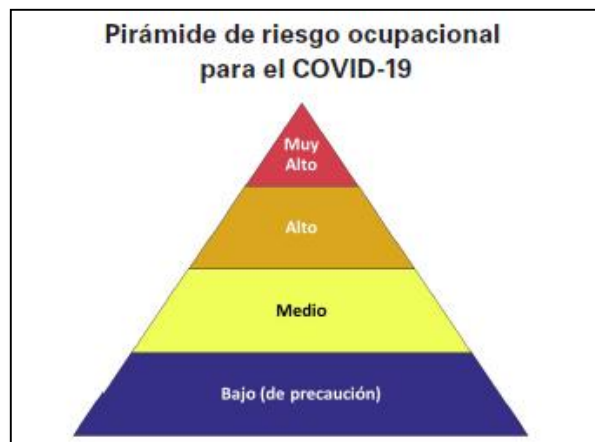
Fig. 1. Nivel de riesgo ocupacional.